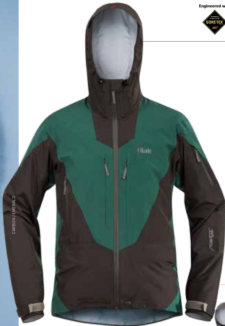
CARBON / EMERALD

Pro zimní aktivity bude nejlépe fungovat s trikem Serak a bundou Ketil.