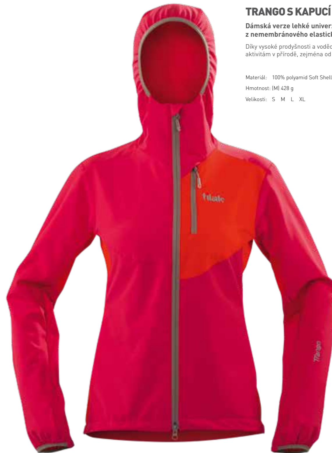
TOMATO RED / RED