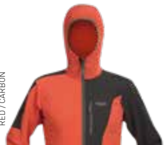
RED / CARBON