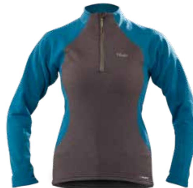
CHARCOAL / MAROCCAN BLUE