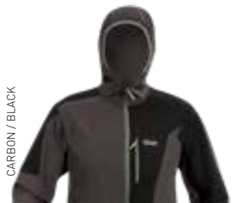
CARBON / BLACK