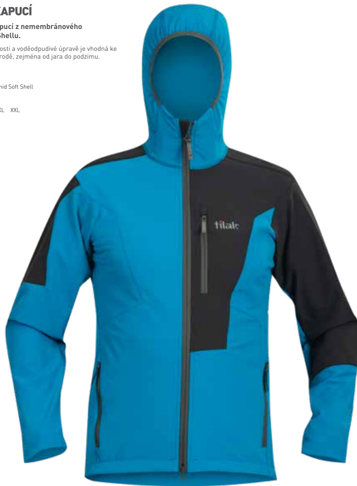
TURKISH TILE / CARBON