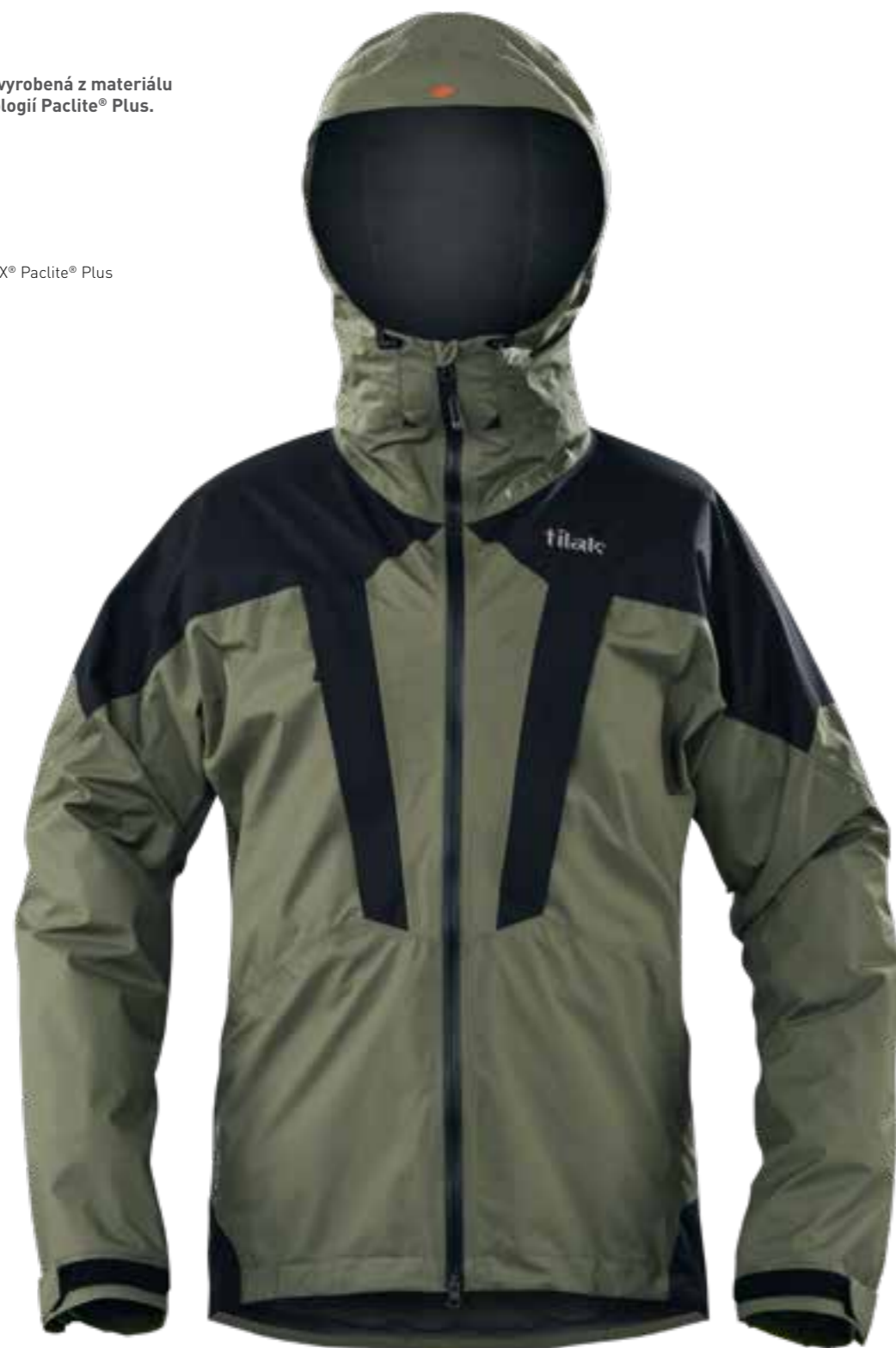
KALAMATA / CAVIAR BLACK