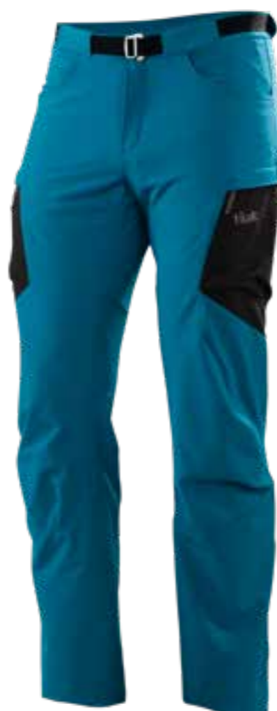
TURKISH TILE / CARBON