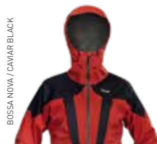
BOSSA NOVA / CAVIAR BLACK