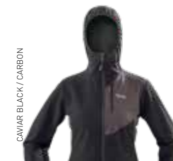
CAVIAR BLACK / CARBON